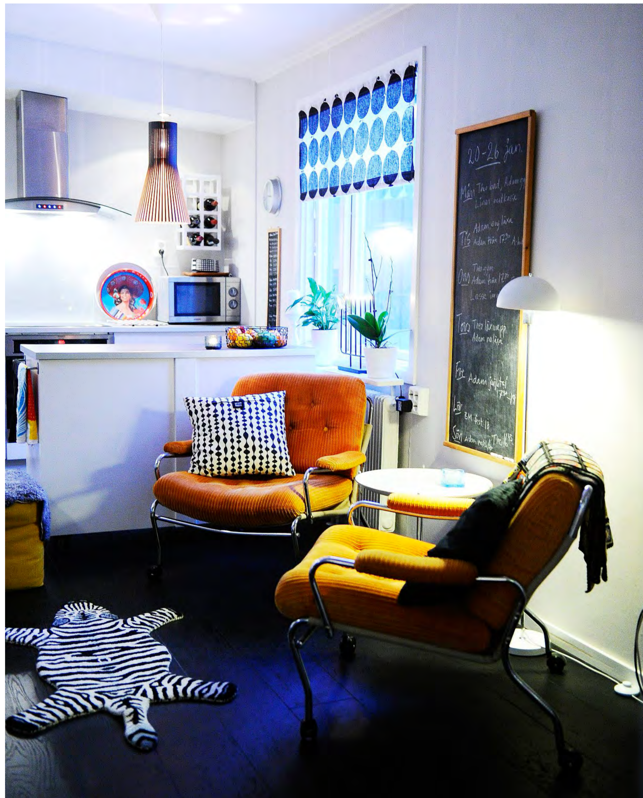
Persbrandtfåtöljen är en given snackis när familjen har gäster. De orange retrofåtöljerna bjuder in till långsittning i köket.

► Udda hem, vackra hem, unika hem. Varje vecka tittar vi in i en norrbottensk bostad med det lilla extra. På bostadssidorna bjuder vi också på praktiska tips som är värda att veta. Dessutom redovisar vi veckans fastighetsaffärer.